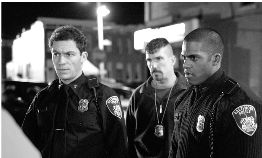
Drót (The Wire)

gyártású sorozatoktól. Ezekben a műsorokban az állami korrupció és a szervezett bűnözés közötti kapcsolat a törvényes és törvénytelen intézmények nagyon magas szintjét éri el, ráadásul a sorozatok mindezen összeesküvéseket újfasiszta csoportok tevékenységéhez is kötik. Ez adja az olasz Suburra háttérét, mely a Bűnügyi regény nyomdokaiba lépve a vadonatúj Zérózérózérót ( Zero Zero Zero , Sky, 2020–) előzi meg, mely sorozatokat ugyanaz a stúdió gyártja. Az említetteknel is provokatívabb a BBC Birmingham bandája című produkciója, melyben a jól ismert gengszter, Thomas Selby megannyi politikai gyilkosságot és terroristatámadást követ el a brit állam titkos – és olykor közvetlenül Winston Churchillhez köthető – szektorainak utasítására. Noha a főszereplőt tettheiért cserébe megválasztják az alsóház tagjának, a műsor nem tesz célzást a társadalom különböző rétegei közti gyümölcsöző kooperációra. Kritikájának központjában ehelyett a raison d'état (államérdek) áll, és az antihőst az állam romantikus, ám kegyetlen ellenségeként ábrázolja. És ez még nem minden. Habár az Európai Unió ritkán kerül elő az európai sorozatokban, az elmúlt évtizedek egyik legvitatottabb európai sorozatának, A nagy pénzrablásnak a