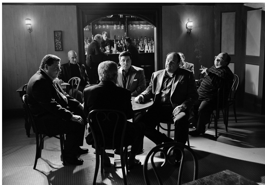
Maffiózók (The Sopranos)

2010—). Ennek következtében az ilyen típusú bűnügyi történetek változatlanul hangsúlyozzák az állam szerepének jelentőségét, valamint a detektívtörténet és a nemzeti identitás közti kapcsolatot.