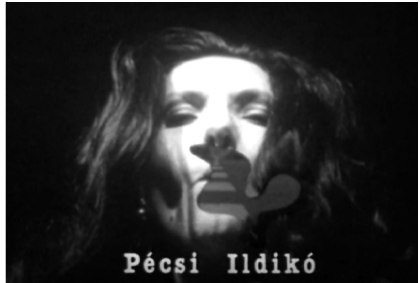
Linda (Pécsi Ildikó)

frusztrált szexkomédiába helyezi, ami különösen erősen utal Gombaszögi örökségére, hiszen mindkét karakter esetében összekapcsolhatók beteljesületlen szexuális vágyaik az extrém kulináris étvágyukkal. 44 A főcím újabb abszurd képsorral utal Pécsi sztárságára: egy rajzfilmszekvencia után, melyben Linda egy dombtetőről leugorva (amely eltűzött, szuperhősi mozdulatsorként ábrázoló-dik) elriaszt egy amerikai autót, a kép a Linda meztelen bokái közül mutatott kanyarodó autó felvételéről Pécsi élszereplős fényképére vált, amelyen kihívó-szuggesztíven néz, és szürcsölő hang kíséretében csücsöríti az ajkát. A vágáseffektnek köszönhetően úgy tűnik, mintha Pécsi Lindát szürcsölné. Ezután egy újabb szürcsölő hanggal és vágási effektussal Pécsi arca az élszereplős, dombtetőn mopedező Lindává változik.