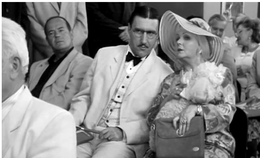
Hippolyt (1999) (Eperjes Károly, Pogány Judit)

bevásárlóutcában sétáltatnak kutyát, ahol a nő be is tér egy ékszerboltnak látszó üzletbe, miközben megbeszélik a férj autójának lecserélését is, noha a hatalmas sárga szippantóskocsi Schneider úr kedvence. Nem mellesleg az autó erős férfiszimbólum, melynek lecserélésével a feleség teljesen átvinné az irányítást férje felett. Ezt az erős nőképet hangsúlyozzák a Schneider asszony edzését bemutató képsorok, melyekben az eredeti filmben is látott egyszerű tornagyakorlatokon túllépve, komoly edzőgépek és súlyemelő-masínák, többkörös futótréningek veszik át a főszerepet, komolyabb hangsúlyt adva ezzel a feleség tornajeleneteinek.