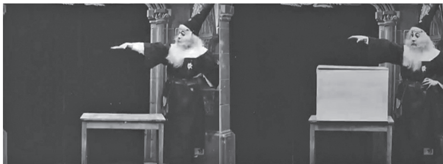
1. ábra: George Méliès asztalt varázsol (A bűvész, 1898)

Méliès a vágást többnyire trükkök létrehozására használta: filmjeiben tárgyak és emberek jelentek meg és tűntek el, hirtelen szakállat növesztett, majd megszábadult tőle, és egyik helyről a másikra termett. Életének későbbi éveiben úgy fogalmazott, hogy a filmjeiben azt fejlesztette tovább, amit előadóként is csinált – az új médium segítségével olyan fantasztikus hatásokat ért el a színházi látványvilágot megtartva, melyek a színpadon csak nehezen vagy egyáltalán nem lettek volna kivitelezhetők. 1895-től 1912-ig több mint ötszáz filmet forgatott le, melyek világszerte bemutatásra kerültek – azonban 1912-re a filmkészítés komoly üzletté nőtte ki magát, és talán ő volt az első független filmes, akit perifériára szorítottak a nagy stúdiók.