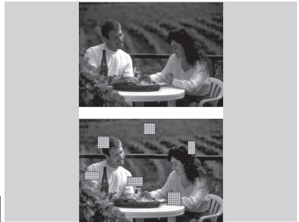
3. ábra: A változás maszkolása a képen. Ha „sárfoltok” jelennek meg a korlát pozíciójának változásával egy időben, az eltérést nagyon nehéz kiszűrni

Smith és Henderson pontosan az ilyen típusú maszkolás hatásait tanulmányozták a vágások érzékelhetőségét vizsgáló kutatásukban, és arra jutottak, hogy a maszkolás úgy működik, ahogy a bűvésztükkök: azokat a vágásokat