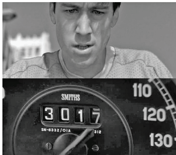
2. ábra: Vizuális kérdés és válasz a Meglógtam a Ferrarival -ban

A vágás tehát működhet a következőképpen is: valami a képen vizuális kérdést generál. Vágás. A következő beállítás megválaszolja a kérdést. A 2. ábra a Meglógtam a Ferrarival ( Ferris Bueller's Day Off , John Hughes, 1986) című filmből ezt a folyamatot szemlélteti. A képen Alan