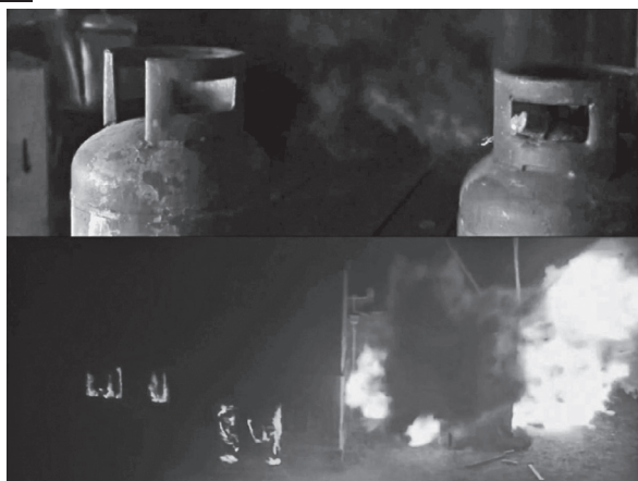
4. ábra: A nagy vizuális változások sokszor elfedik a vágásokat. Fent: A Skyfall vége felé Bond előkészíti család kastélyának felrobbantását. A gyújtószinór leég az egyik tartály felé. Lent: Rögtön a vágás után kívülről mutatja a kamera, ahogy a ház felrobban.

A filmesek egyik arany szabálya a mozgásban vágás ( cutting on action vagy match on action ). E szabály szerint, amikor csak lehet, a vágás félbe kell hogy szakítsa az adott akciót, tehát az adott mozdulatnak a vágás előtti és utáni beállításból kell összeállnia. Mondjuk, az első beállításban az látjuk, ahogy egy nő az ernyő után nyúl: az ernyő felé fordul és kinyújtja a karját. Vágás. A következő képen a mozgásban lévő kart látjuk, ahogyan felveszi az ernyőt. A mozgásban vágás a maszkolás világos és egyértelmű alkalmazási módszere. Az érzékszervi változásokat, melyek a nőt mutató képek közti vágás okoz, elfedi a nő mozdulata, ami a vágás után folytatódik.