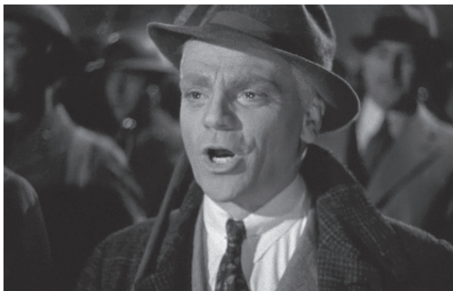
Yankee Doodle Dandy (James Cagney)

meg, hogy a szereplőkhöz önálló, független entitásként viszonyulunk és „külső szemszögből” kapcsolódunk. 16 A bevonódás tágabb és semlegesebb fogalom, ami jobban meg tudja jeleníteni azt a sokféle érzelmi élményt, ami a szereplőkhöz való viszonyulásunkat jellemezheti a rajongástól kezdve a fortyogó gyűlöletig, az affektív mimikritól az elutasításig. A bevonódás eredményezhet empátiát és ellenszenvet, szimpátiát és közönyt, és semmi esetre sem feltételezi a tudatok és identitások összeolvadását. 17