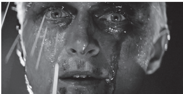
Szárnyas fejevadász (Rudger Hauer)

Az empátiajelenetre adott reakciónk a filmek többségénél azon múlik, hogy a karakter szerintünk megérdemli-e az együttérzésünket vagy sem. A Zongoralecke esetében például az empátiajelenet által kiváltott érzelmeinket az határozza meg, hogy Ada zongorája elvesztésén érzett fájdalmát jogosnak találjuk-e. Vagy hogy egy másik példát nézzünk: ha a Becsületből elégtelen című film kapcsán úgy véljük, hogy a főszereplő, Jefferson Smith a kezdetektől fogva reménytelenül naiv volt, akkor nagy valószínűséggel nem érzünk majd iránta empátiát, amikor a szövetségi kormány korrupciójával szembesülve összeomlik.