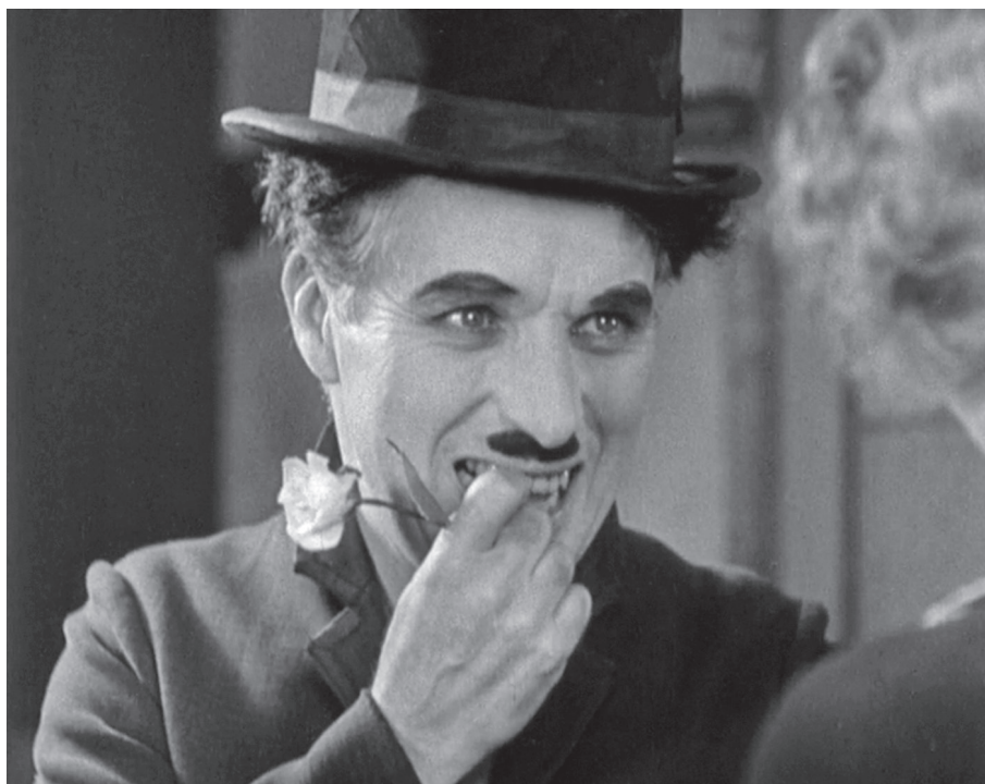
Nagyvárosi fények (Charlie Chaplin)

kapcsolatunkat az összetartozás és/vagy hasonlóság, nem pedig a függetlenség és különbözőség fogalmával írjuk le. 26 Szintén jóval nagyobb valószínűséggel alakul ki az érzelmi fertőzés, ha olyasvalakiról van szó, akit kedvelünk. Ha semmiféle rokonszenvet vagy elköteleződést nem érzünk a filmi karakter iránt, vagy esetleg épp ellenkezőleg, kifejezetten ellenszenvesnek találjuk, akkor igen kis esély van arra, hogy a karakter empátiás reakciót váltson ki belőlünk. Még ha ki is alakul egy bizonyos fokig önkéntelen, reflexszerű reakció az emberi arc láttán, ha ez olyasvalaki arca, aki iránt közömbösek vagyunk, akkor feltehetően könnyebben távolodunk el a szereplőtől, engedjük, hogy elterelődjön a figyelmünk, de az is előfordulhat, hogy szándékosan ellenállunk az érzelmi készletének.